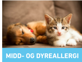
MIDD- OG DYREALLERGI

Allergimedisin blir stadig mer effektiv. Spør legen din om du har riktig medisin.